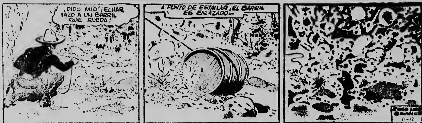
Porfin Cisco a logra laza e barril cu tabata cla pa rebenta. Mientras tanto tur e labriegonan a corre bai busca caminda pa nan scardale nan curpa. Nan a keda bon leuw for dje lugar para ta leor...